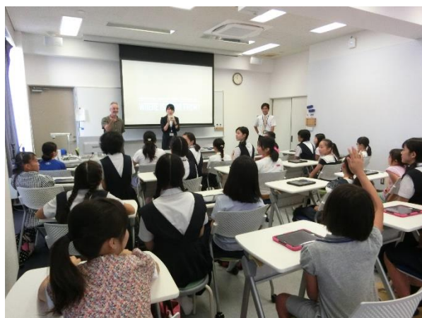
小学校体験プログラム「Global Studies お寿司のネタは、どこ生まれ？」の様子