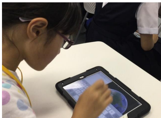
参加者のタブレット端末利活用の様子 (Global Studis 体験授業)