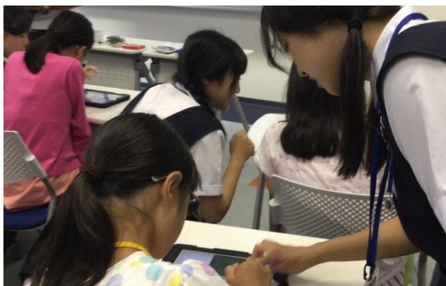
本校 高校生によるサポートの様子 (Global Studis 体験授業)