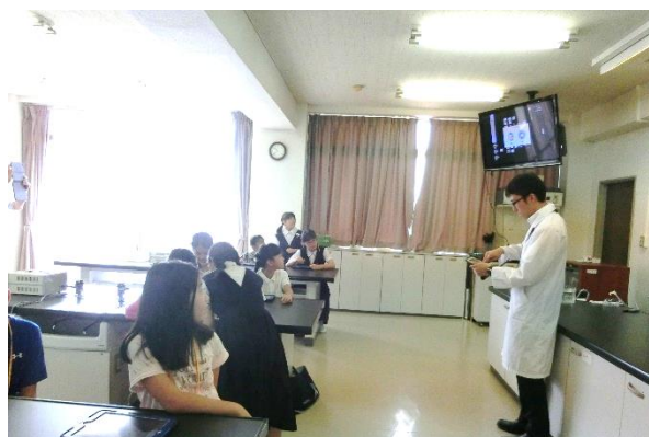
授業支援アプリを使用した分かち合いの様子